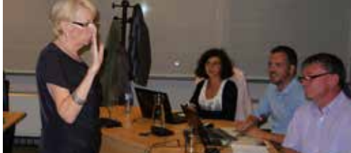
Nieuw N-VA-gezicht in gemeenteraad p. 2