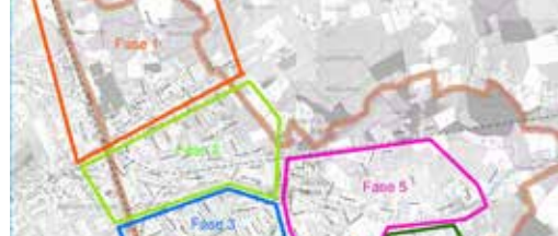
Ruiming en inspectie rioleringen p. 3