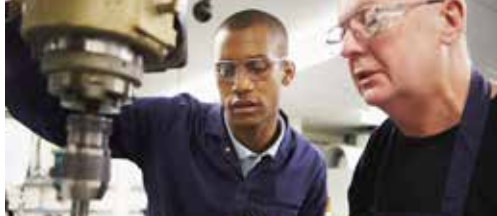
OCMW begeleidt beter naar werk p.2