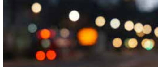
Minder licht = niet meer misdaad p.3