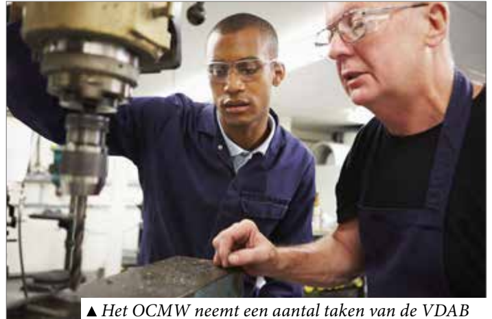
▲ Het OCMW neemt een aantal taken van de VDAB over om mensen aan werk te helpen.

Het circuit van de alternatieve werkervaring is bedoeld voor mensen met een beperktere taalkennis en beperkte mogelijk-